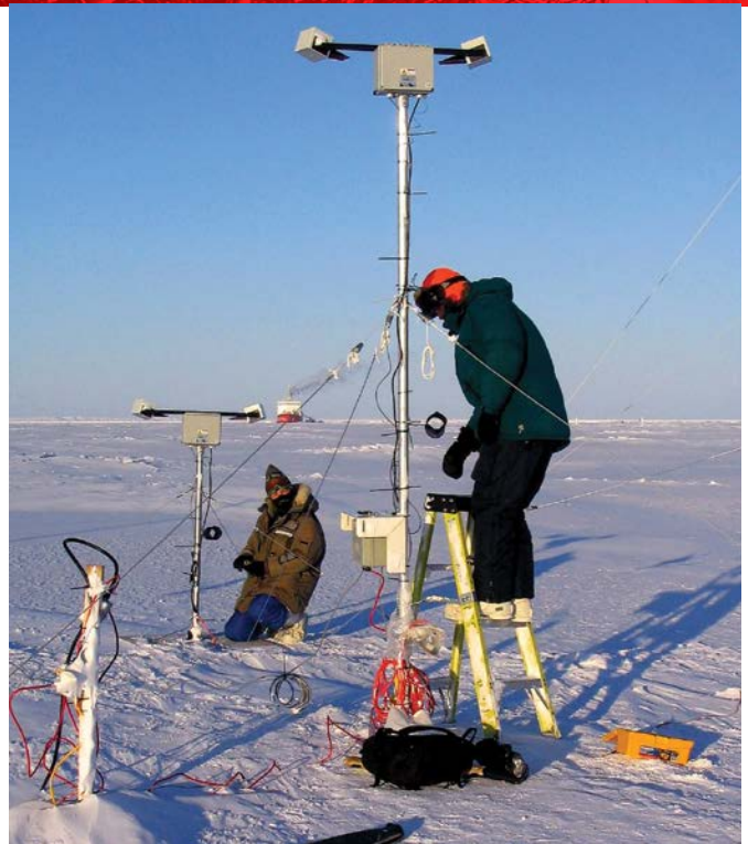
Station d'essais arctique.

Le Programme d'aide à la recherche industrielle du Conseil national de recherches du Canada fournit des services-conseils d'ordre technique adaptés aux besoins des entreprises et, dans certains cas, un soutien financier pour aider à la croissance de PME canadiennes.