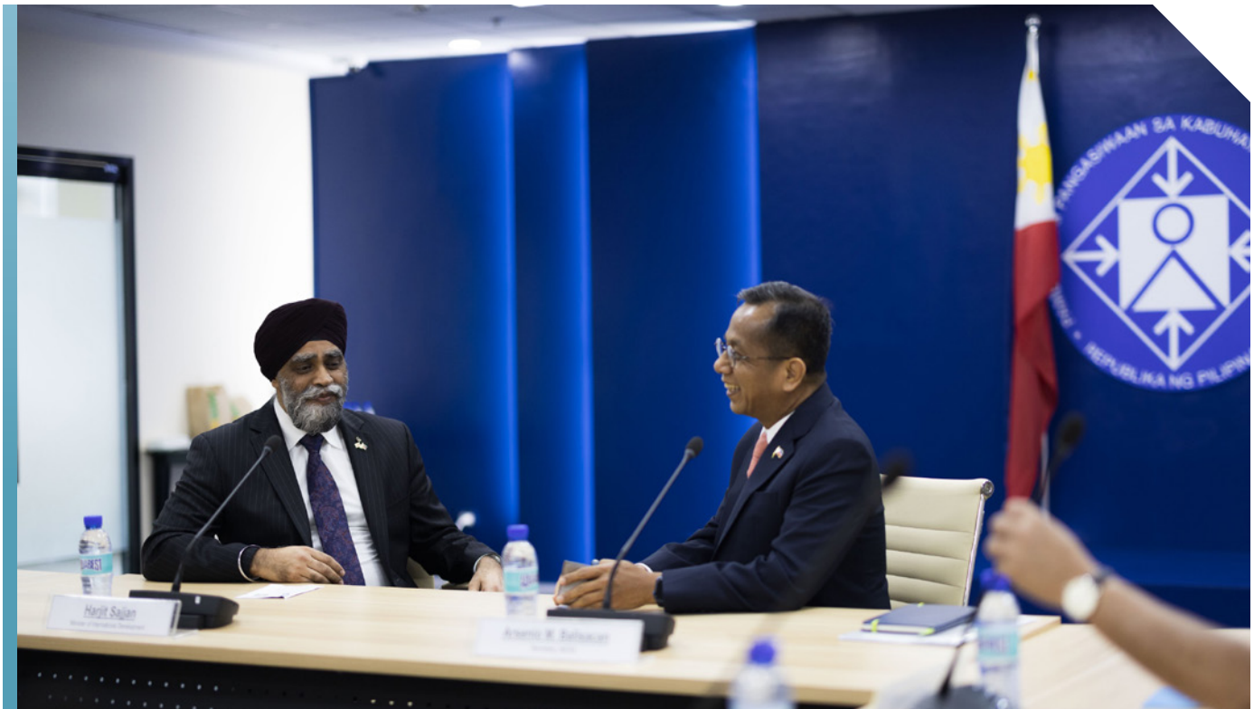
Visite du ministre Sajjan aux Philippines, en mars 2023