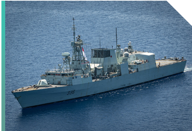
Le NCSM Montréal de la MRC a été déployé dans l'Indo-Pacifique en 2023

d'un navire de soutien, le NM Astérix (de mars à décembre 2023) pour soutenir l'opération NEON et l'opération HORIZON (anciennement PROJECTION).