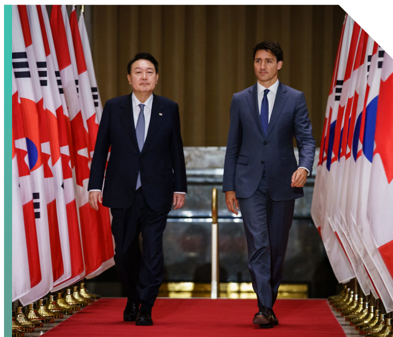
Le premier ministre Justin Trudeau rencontrant le Président de la République de Corée, Yoon Suk Yeol, en septembre 2022