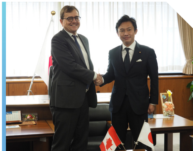
Le ministre de l'Énergie et des Ressources naturelles, Jonathan Wilkinson, rencontre son homologue japonais, en janvier 2023