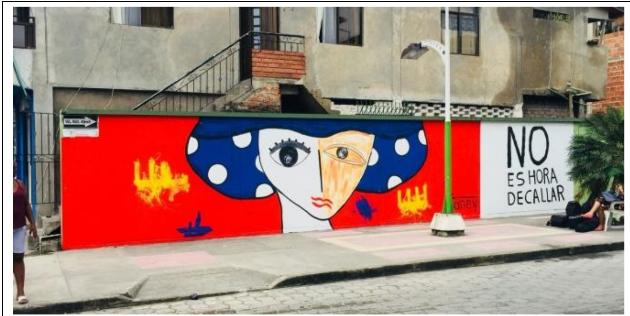
Vibrante mural de una mujer cuyo rostro está adornado con dos expresiones muy diferentes del artista colombiano Vianey.

La Embajada de Canadá en Colombia continuará abogando por la eliminación de la violencia contra las mujeres y el empoderamiento de mujeres y niñas en Colombia.