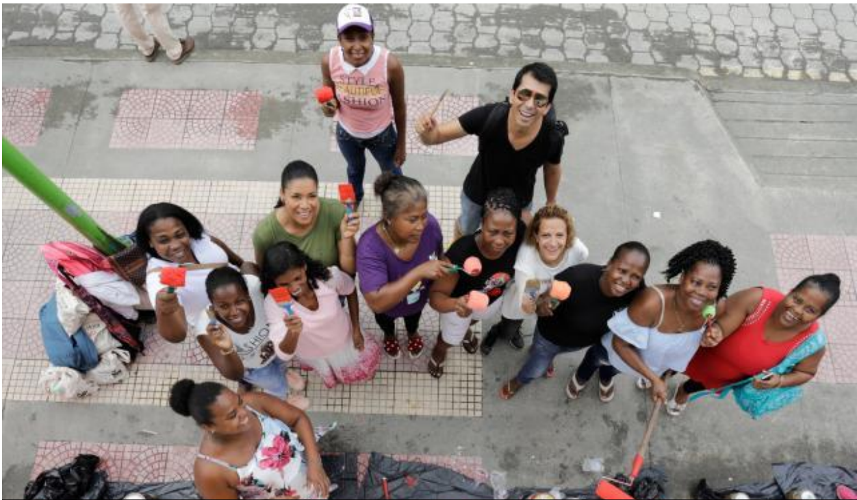
Canada en Colombia Empoderamiento femenino | 17 de abril de 2018

Los participantes pintan un mural colectivo con el artista colombiano Vianey.